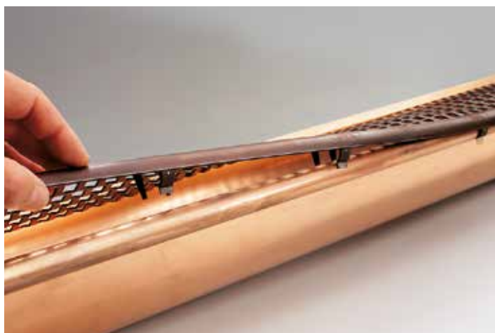
Snadná montáž s integrovanými sponami.

Umístíte DARI-FIX do nebo na okap, v závislosti na konstrukci okapu a velikosti okapu připevníte element na okapovou hranu. Zarovnejte prvky dlouhé jeden metr podle délky okapu. V případě potřeby odříznete přesahy.