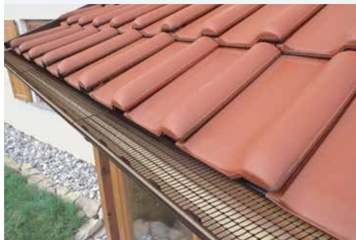
Téměř neviditelná ochrana proti nečistotám a zanesení listy je plně nainstalována.